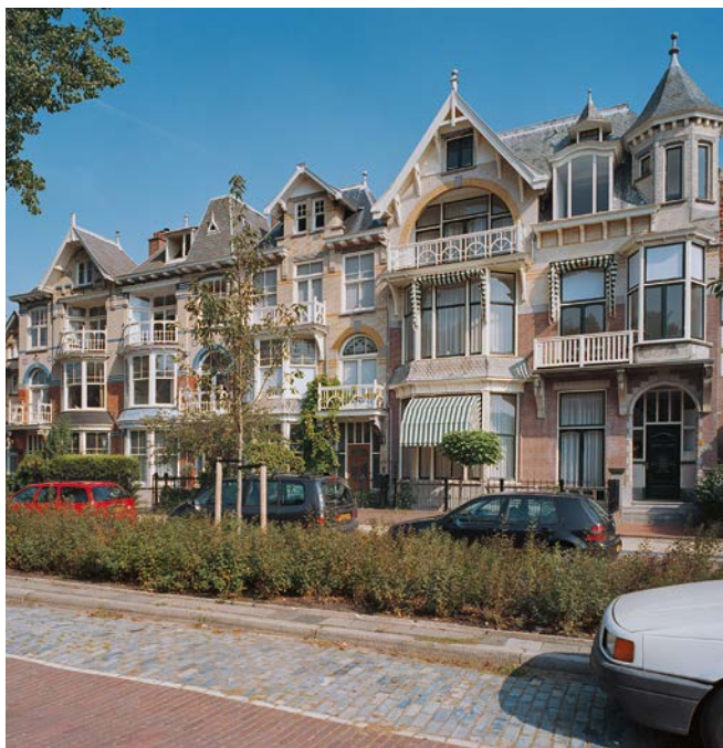
Luxe woningen, Badhuisweg 226-232, in Den Haag, ca. 1900. G.J. Dukker 2003

Vanwege de veiligheid wordt nadrukkelijk geadviseerd de draagconstructie om de paar jaar te controleren op gebreken, vooral als de erker op uitstekende houten balken rust. Bijvoorbeeld de Monumentenwacht kan op verzoek een inspectie uitvoeren. Een bijkomend probleem is dat de draagconstructie niet altijd direct zichtbaar is vanwege aftimmeringen.